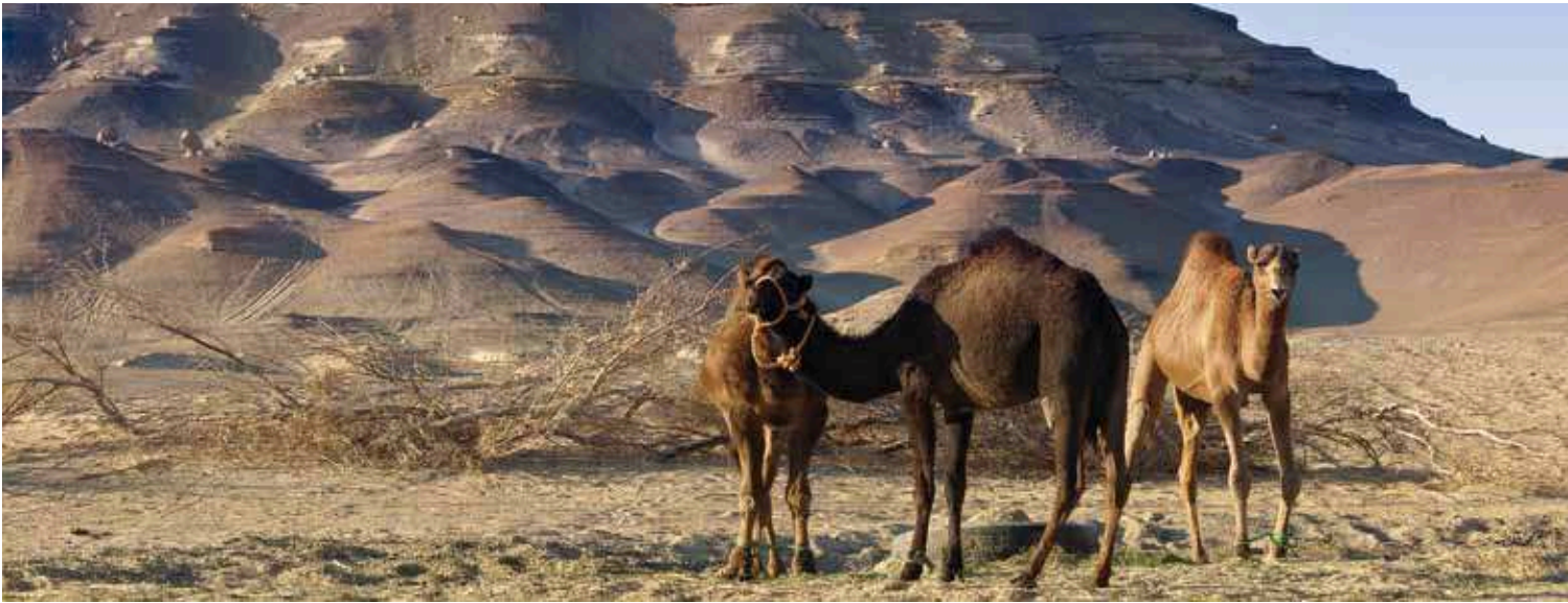
Umgebung der Bahareya-Oase

8: Kairo-Sharm el-Sheikh-Schweiz Frühstück im Hotel. Transfer zum Flughafen von Kairo und Rückflug via Sharm el-Sheikh in die Schweiz oder Fortsetzung Ihres Ägypten-Aufenthaltes.