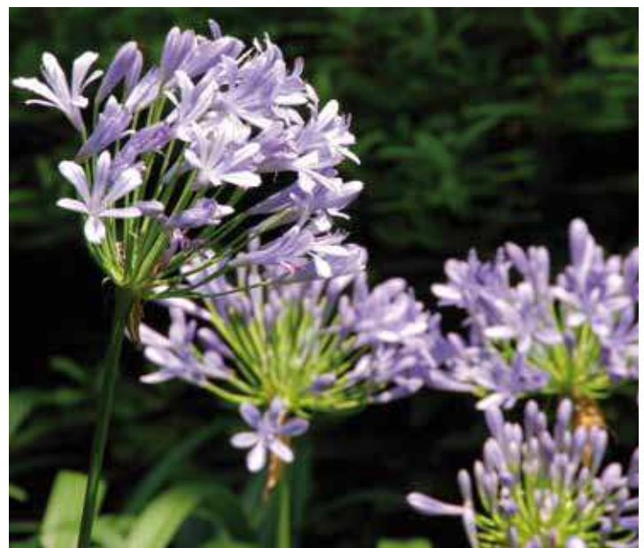
Schmucklilie «Die Blaue Lilie vom Nil»